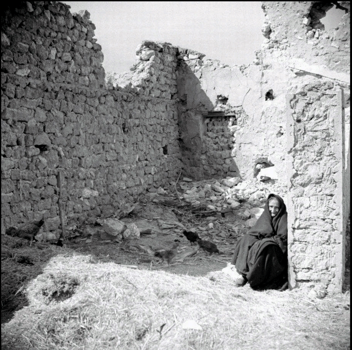
Señora mayor cuidando su corral