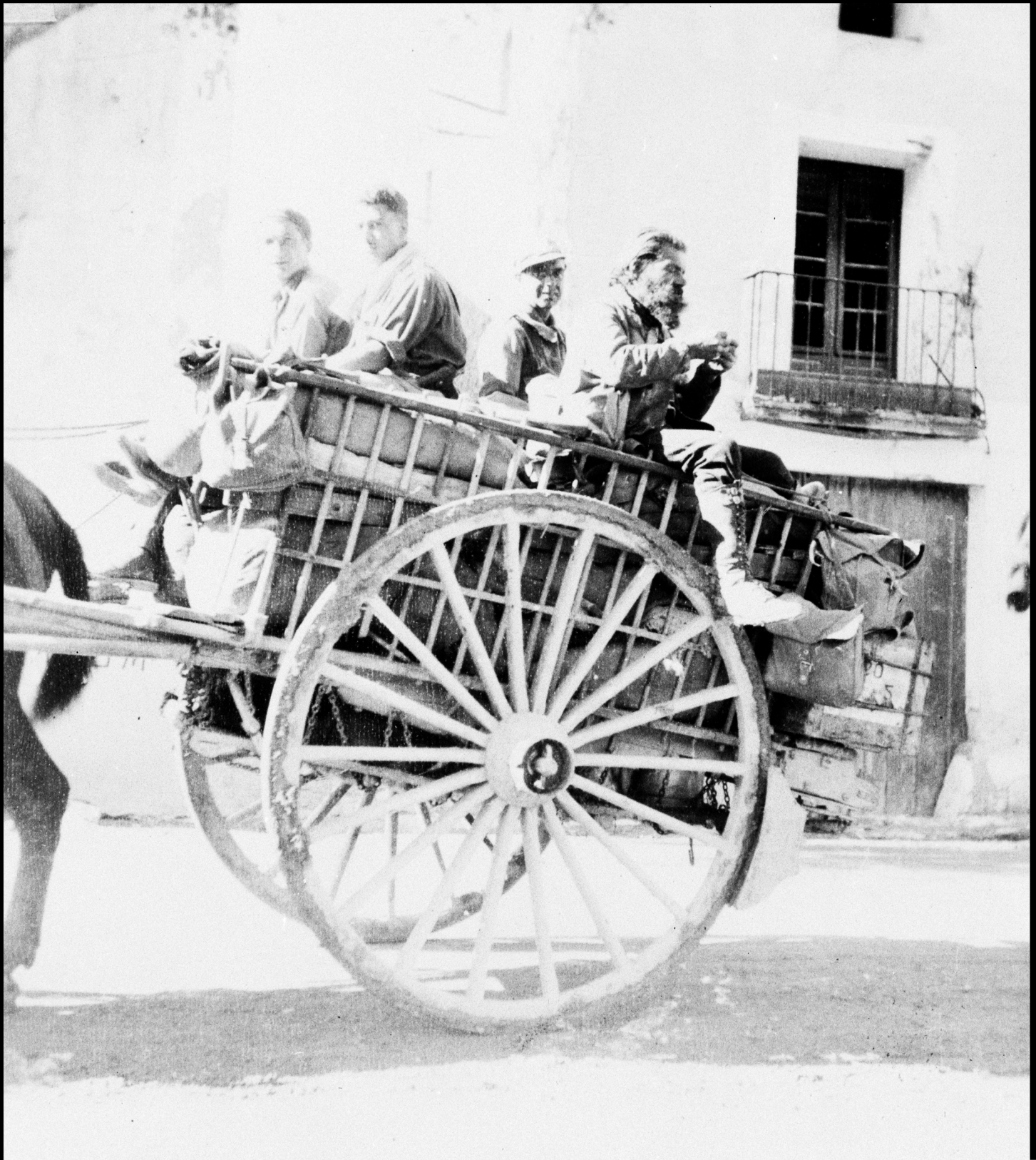
Carro con soldados republicanos de camino al frente de Fuentes