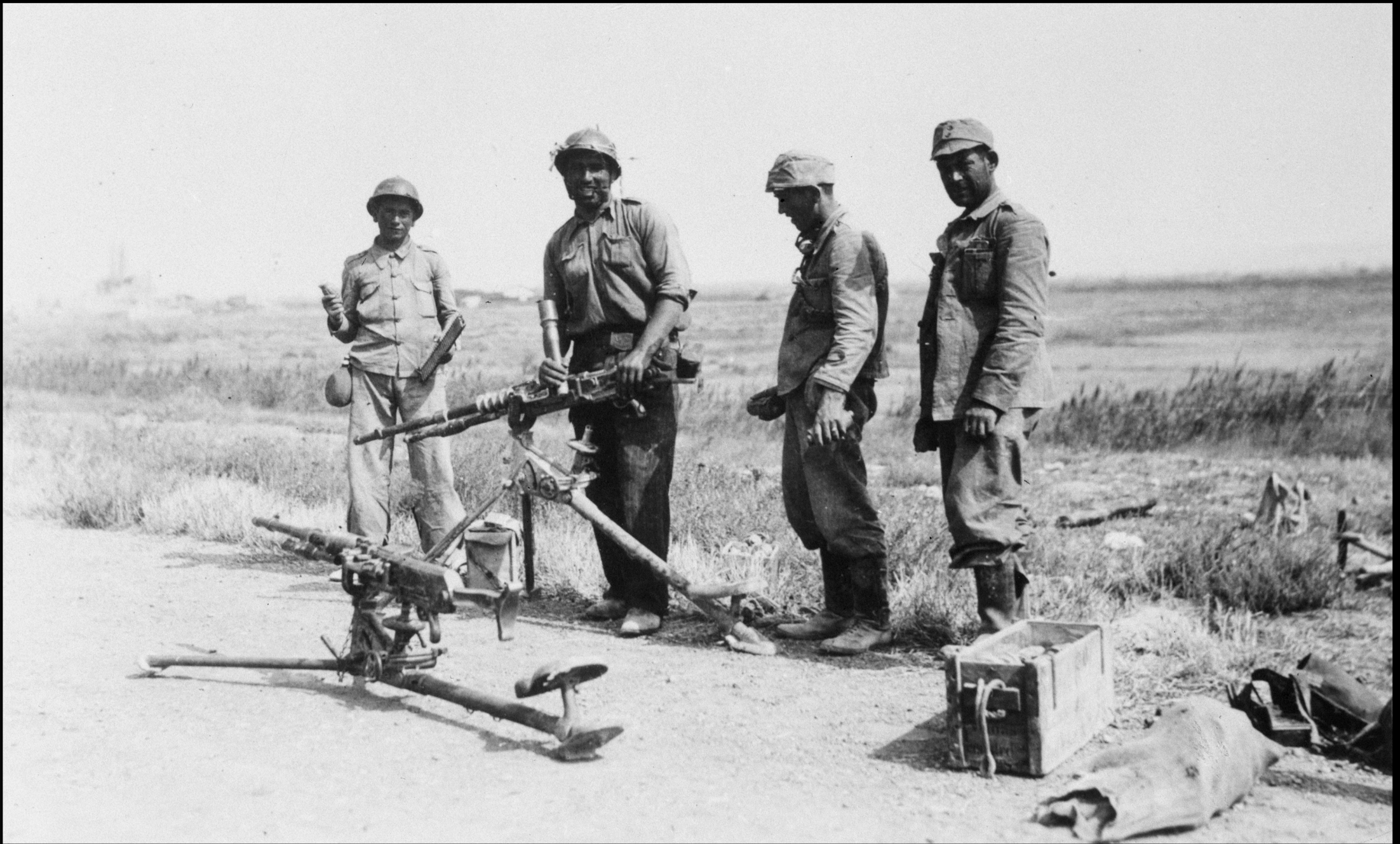
Soldados con armamento, al fondo la cementera