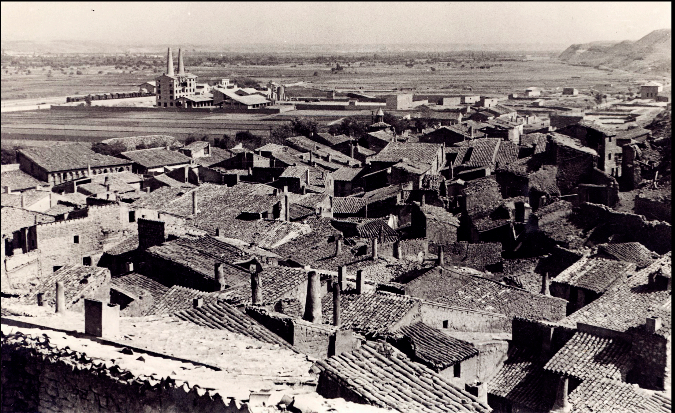
Fabrica de cementos y estación al fondo