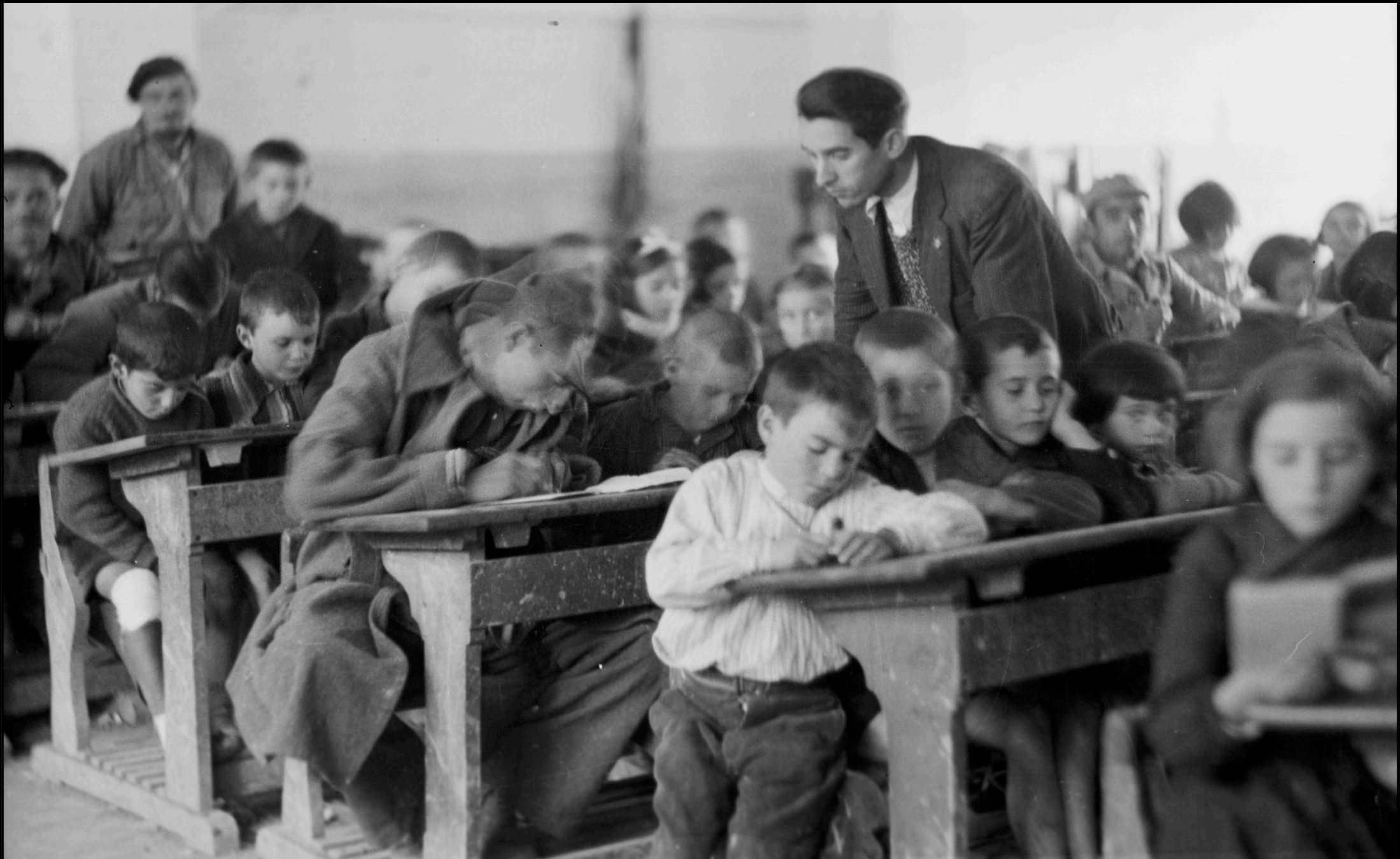
Niños y milicianos en la escuela de Quinto