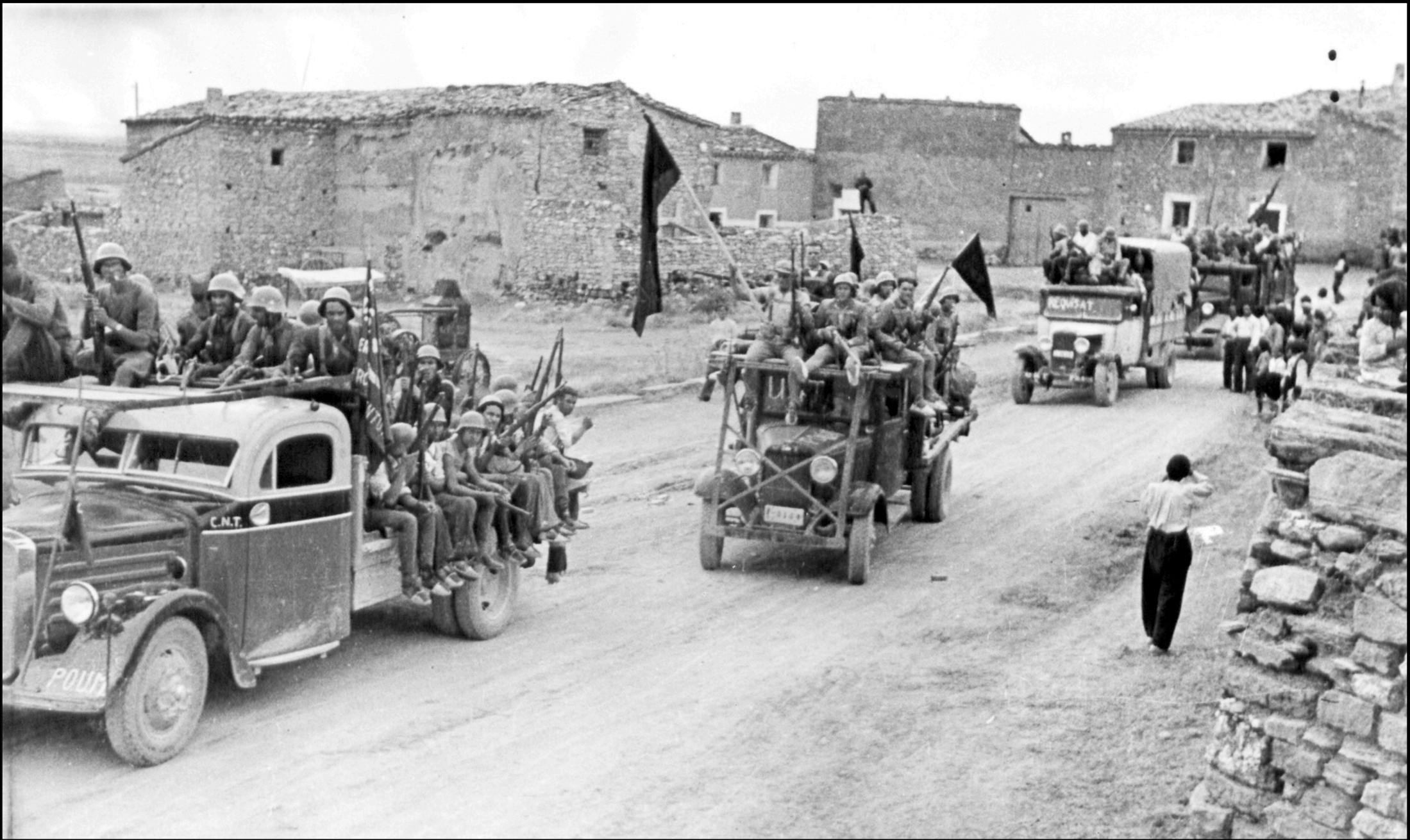
Tropas republicanas camino de Quinto