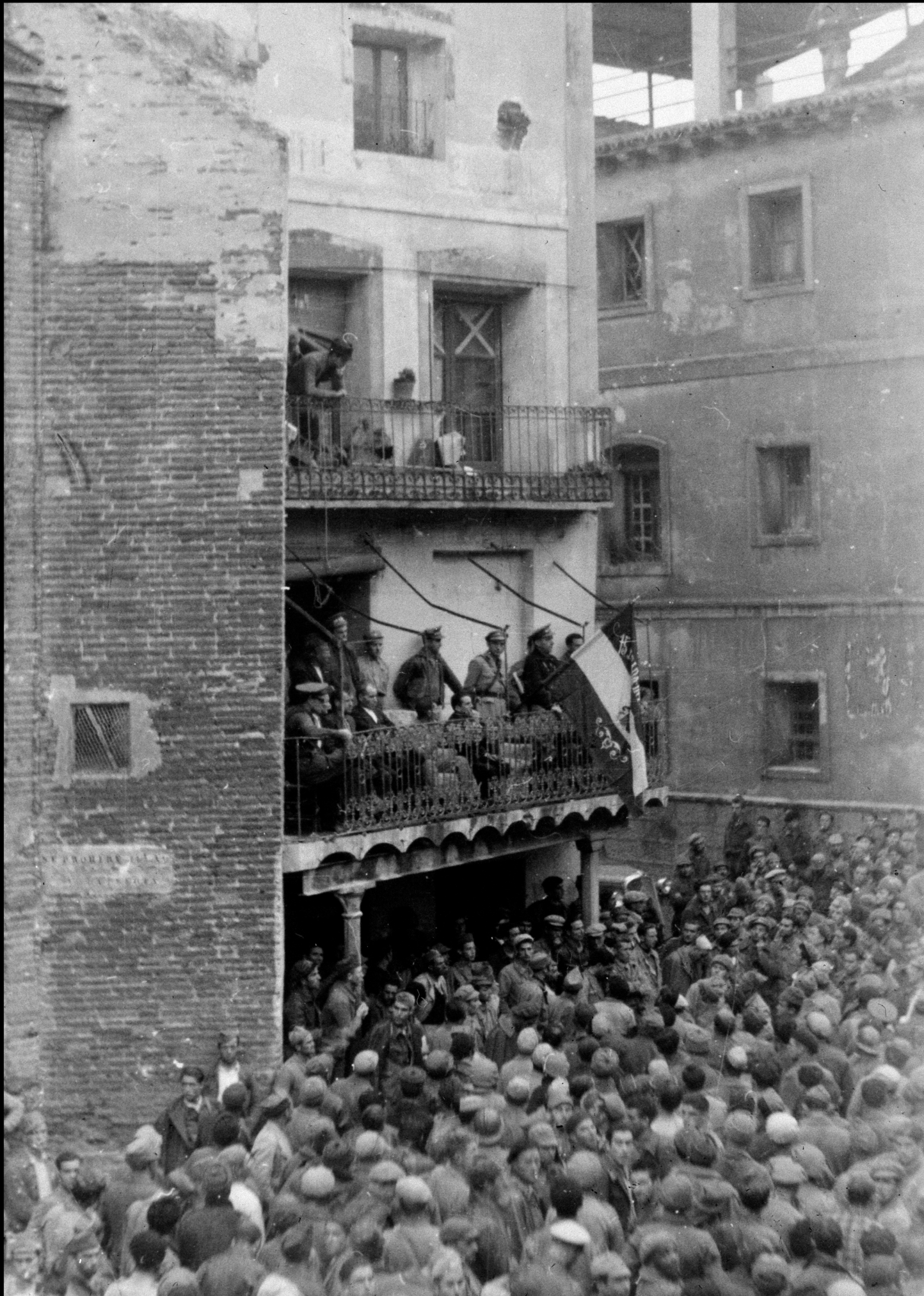
Fiesta aniversario Brigadas Internacionales