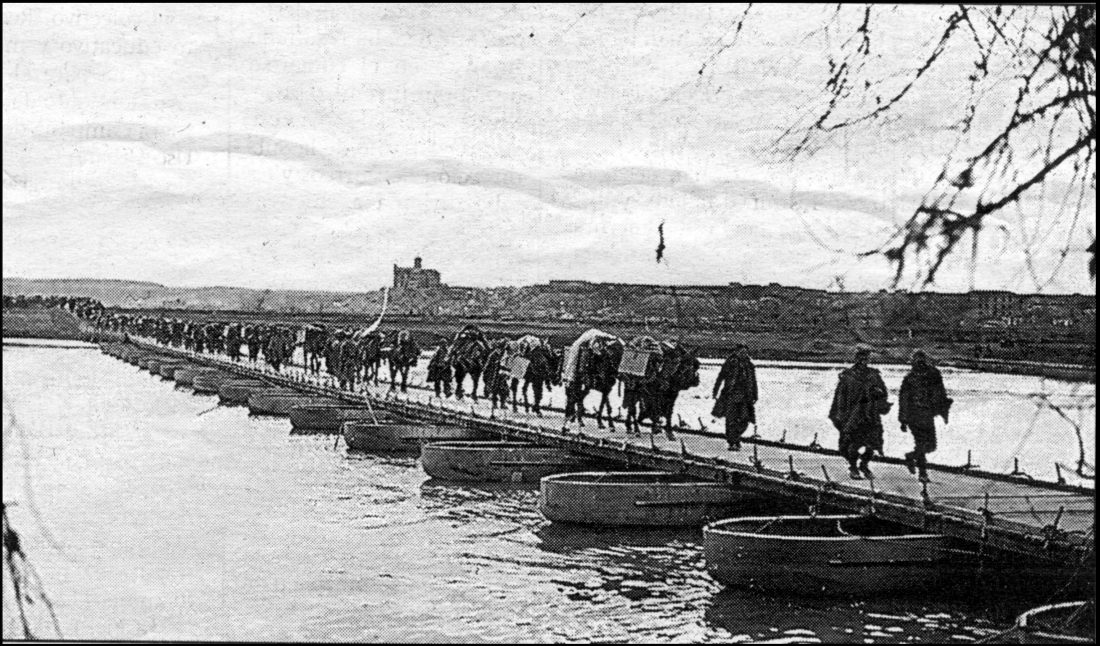
Tropas nacionales en Belloque