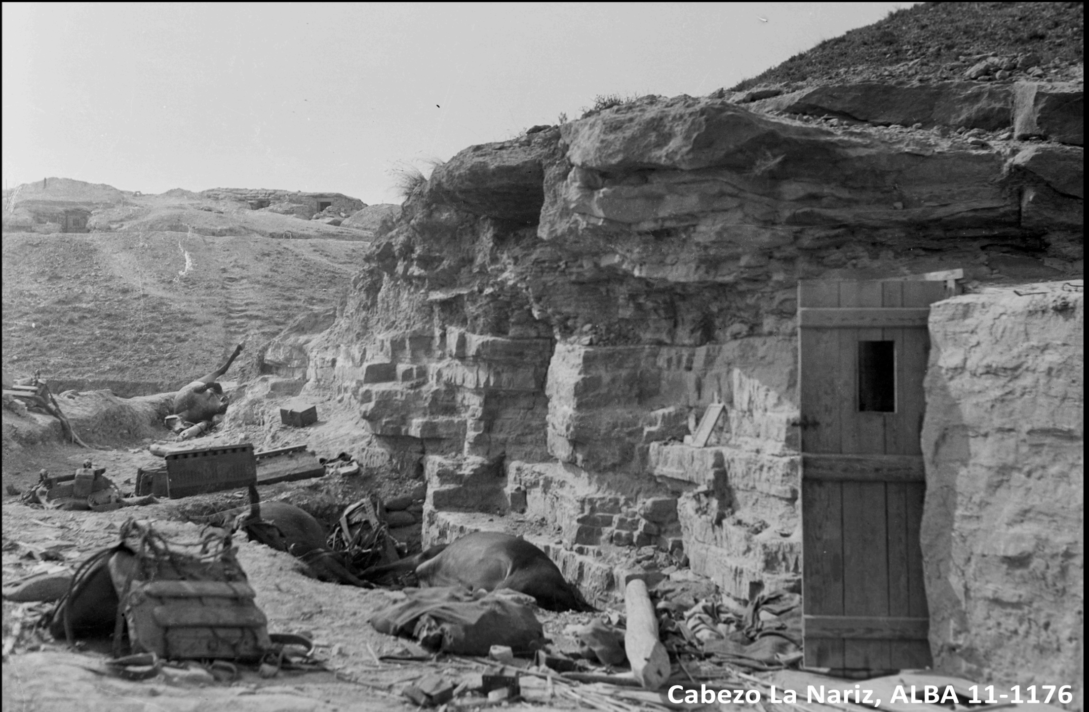
Cabezo La Nariz, ALBA 11-1176