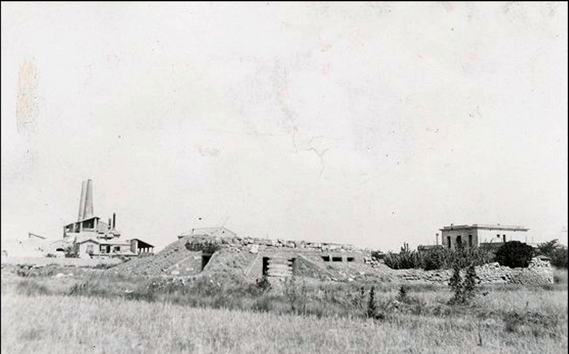
Fabrica de cementos, bunker y estación