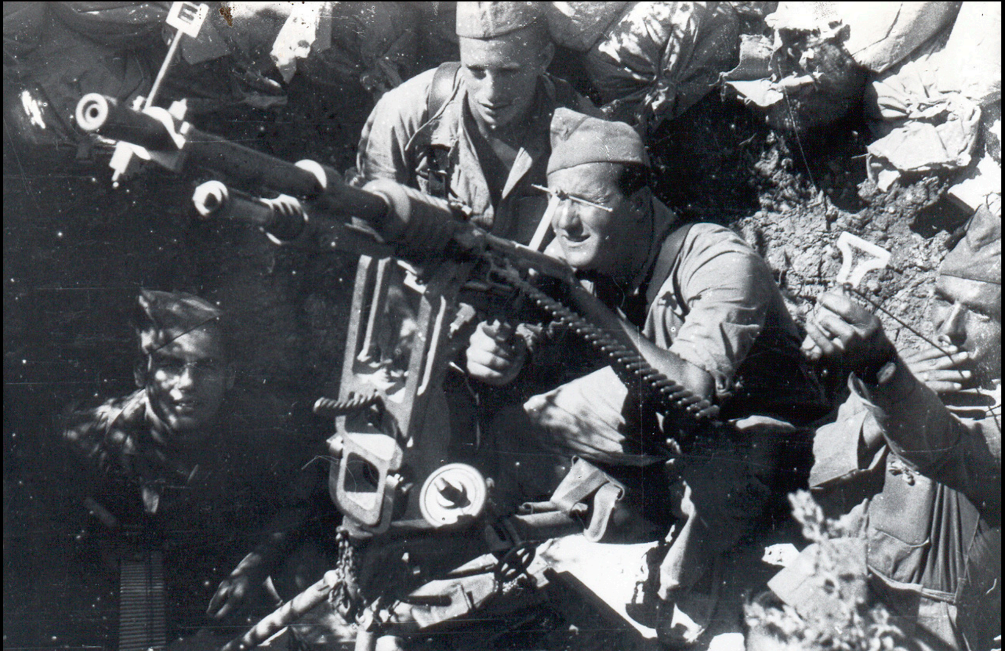
Puesto de ametralladoras en Quinto