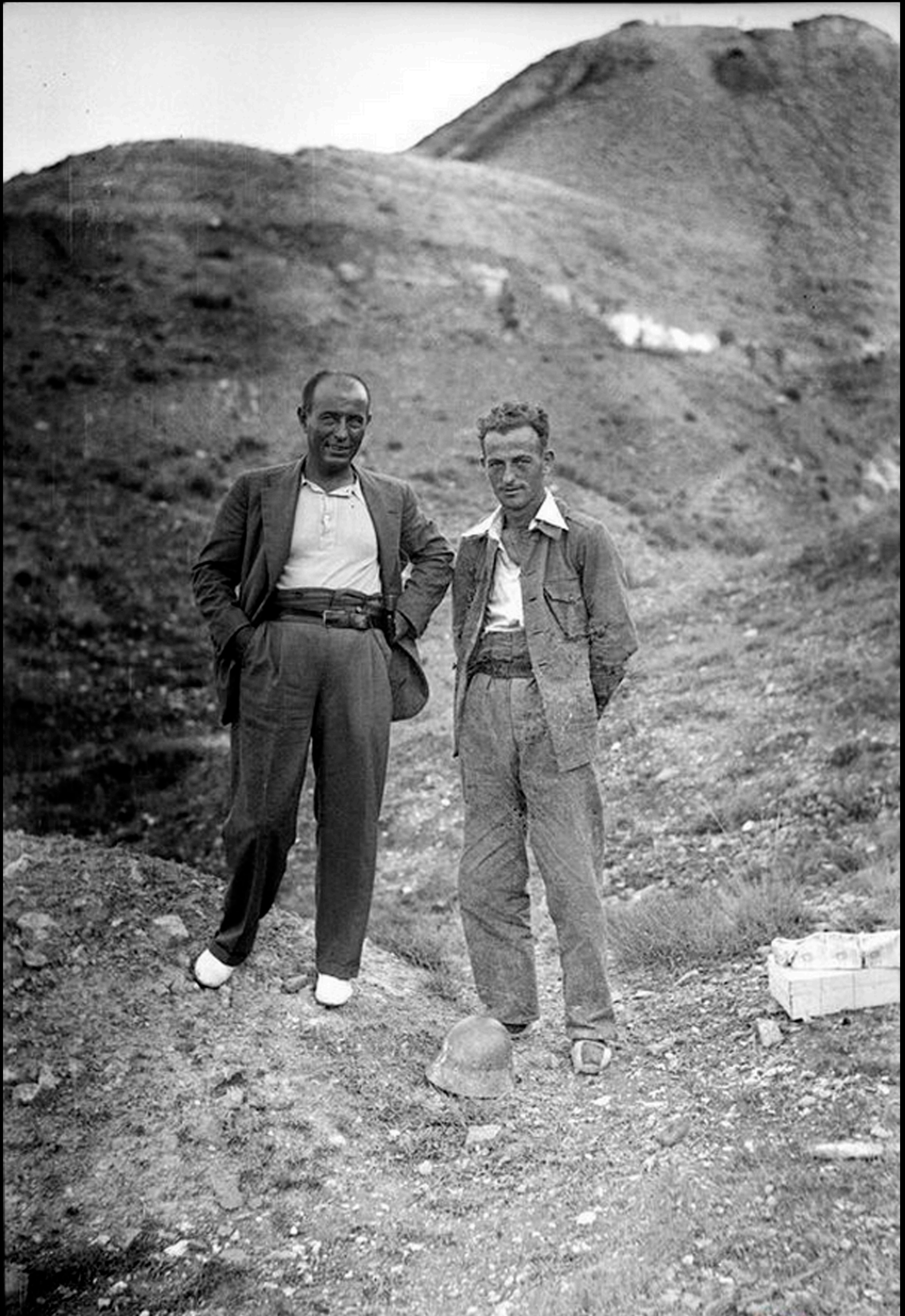
Cabezo la Nariz