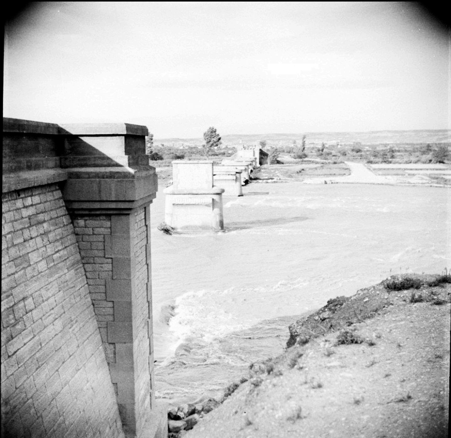
Pilastras del puente de Gelsa