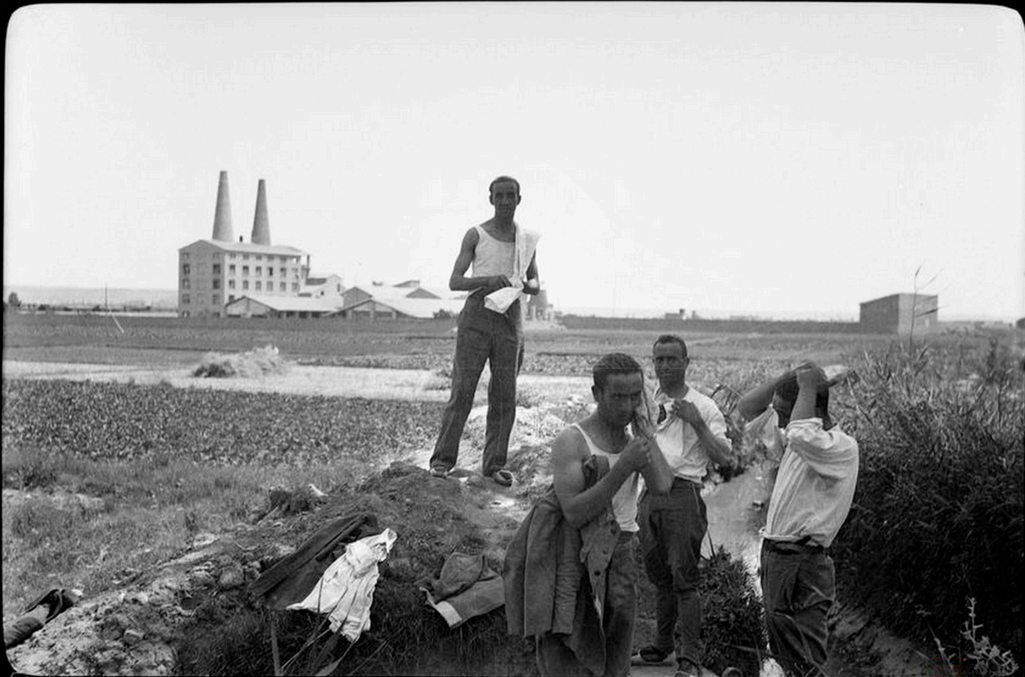
Soldados nacionales, Fábrica de Cementos al fondo