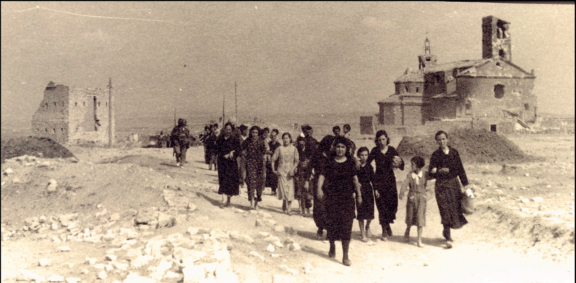
Evacuación de la población civil saliendo de Quinto hacia la Loma del Cornero