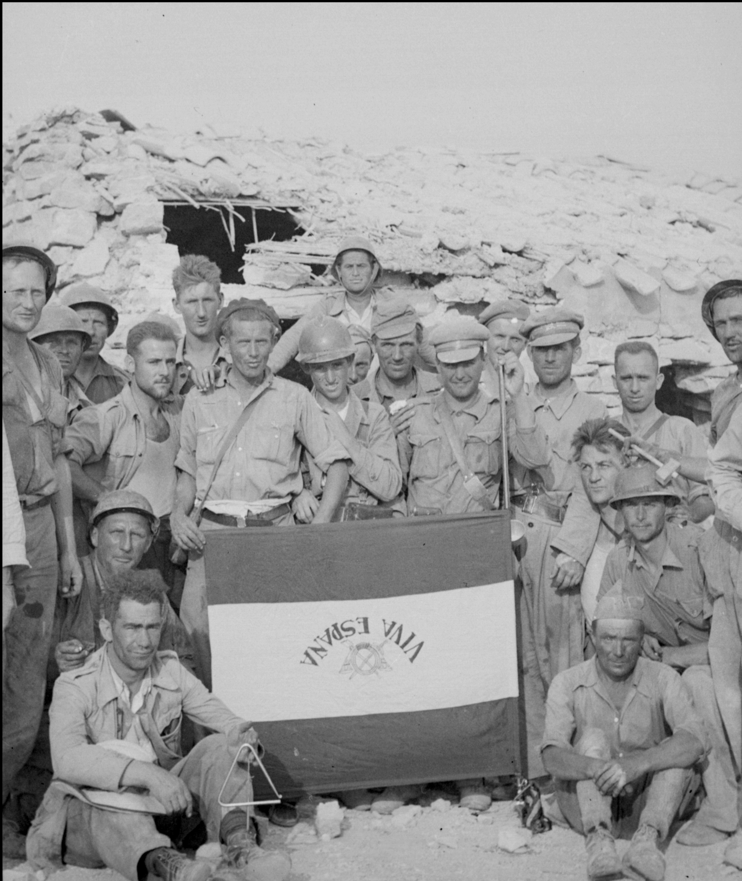
Milicianos con bandera nacional capturada en Quinto