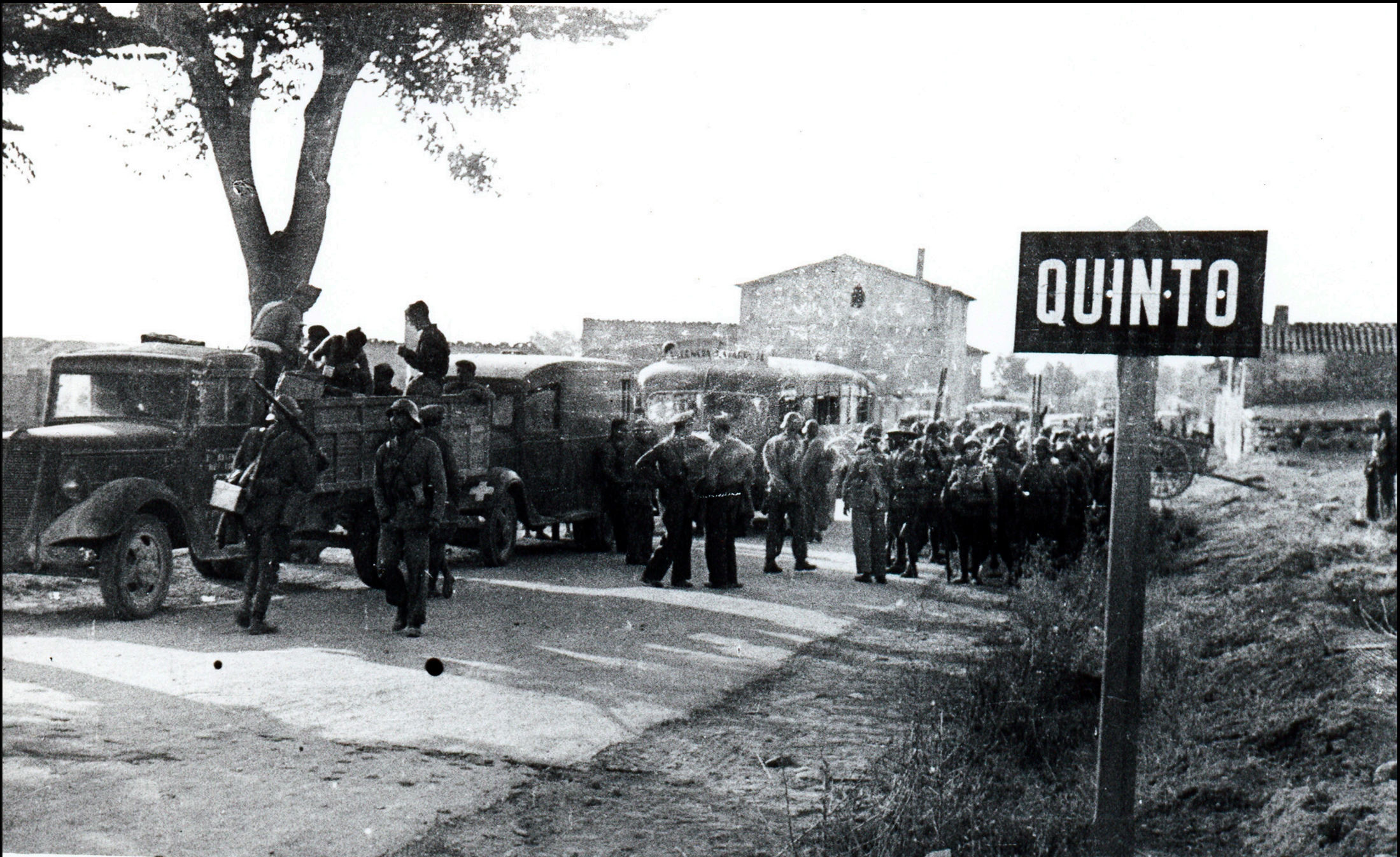
Tropa republicana en el Jardín