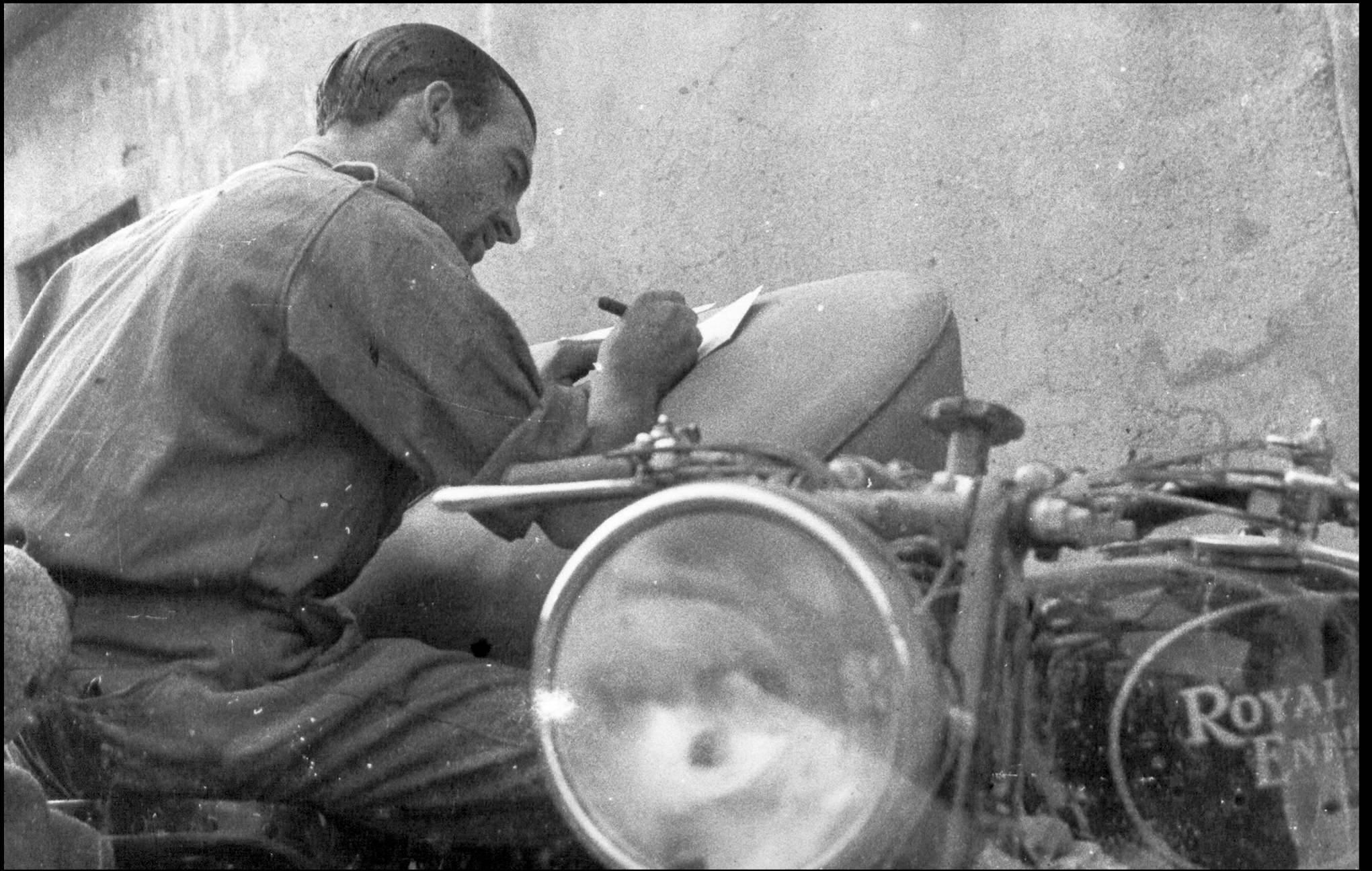
Brigada motorizada en Quinto