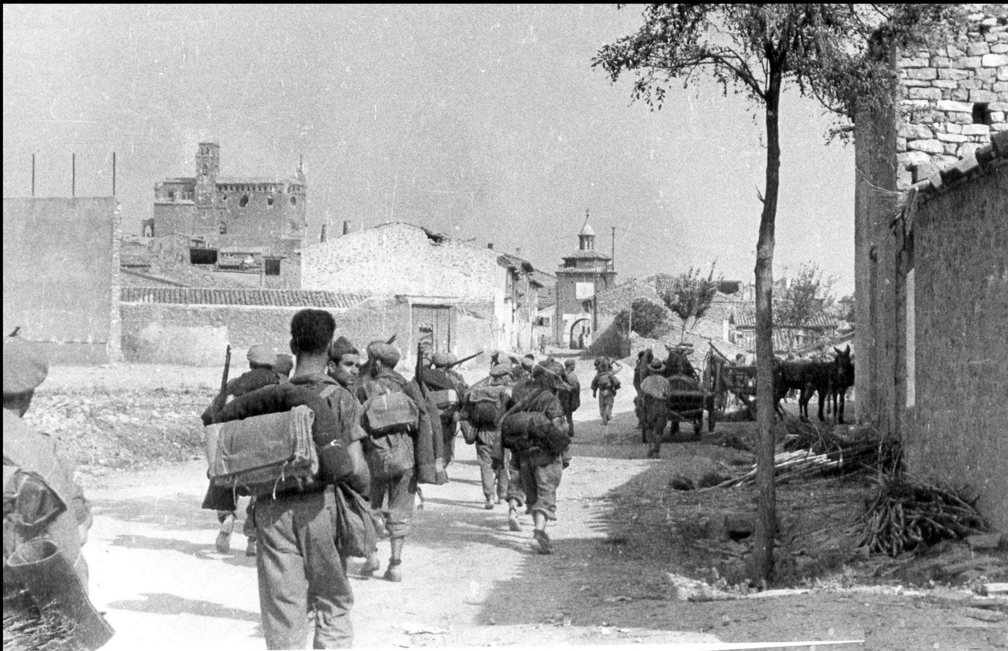
Tropas republicanas, Carretera