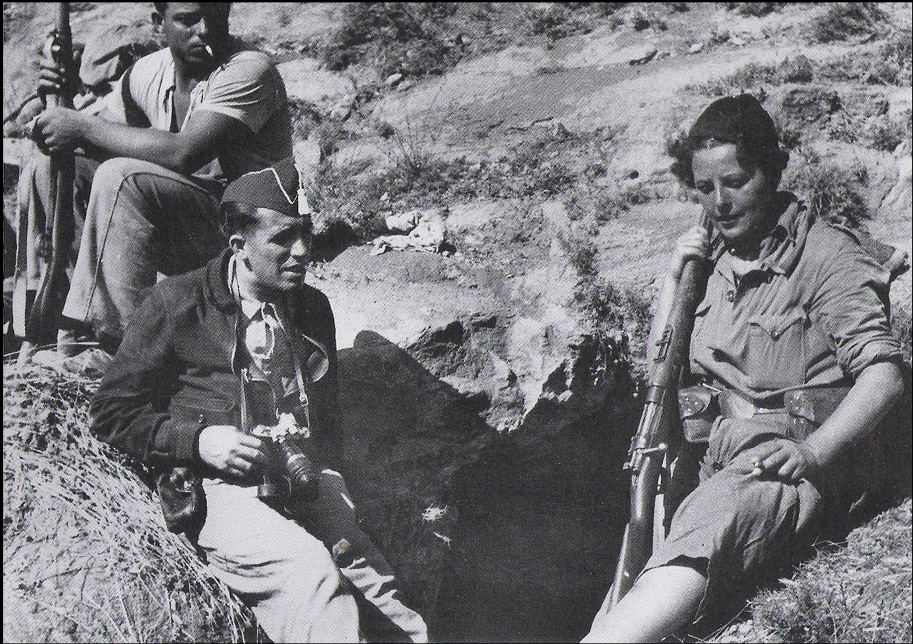
Agustí Centelles en el frente de Aragón. Septiembre 1937