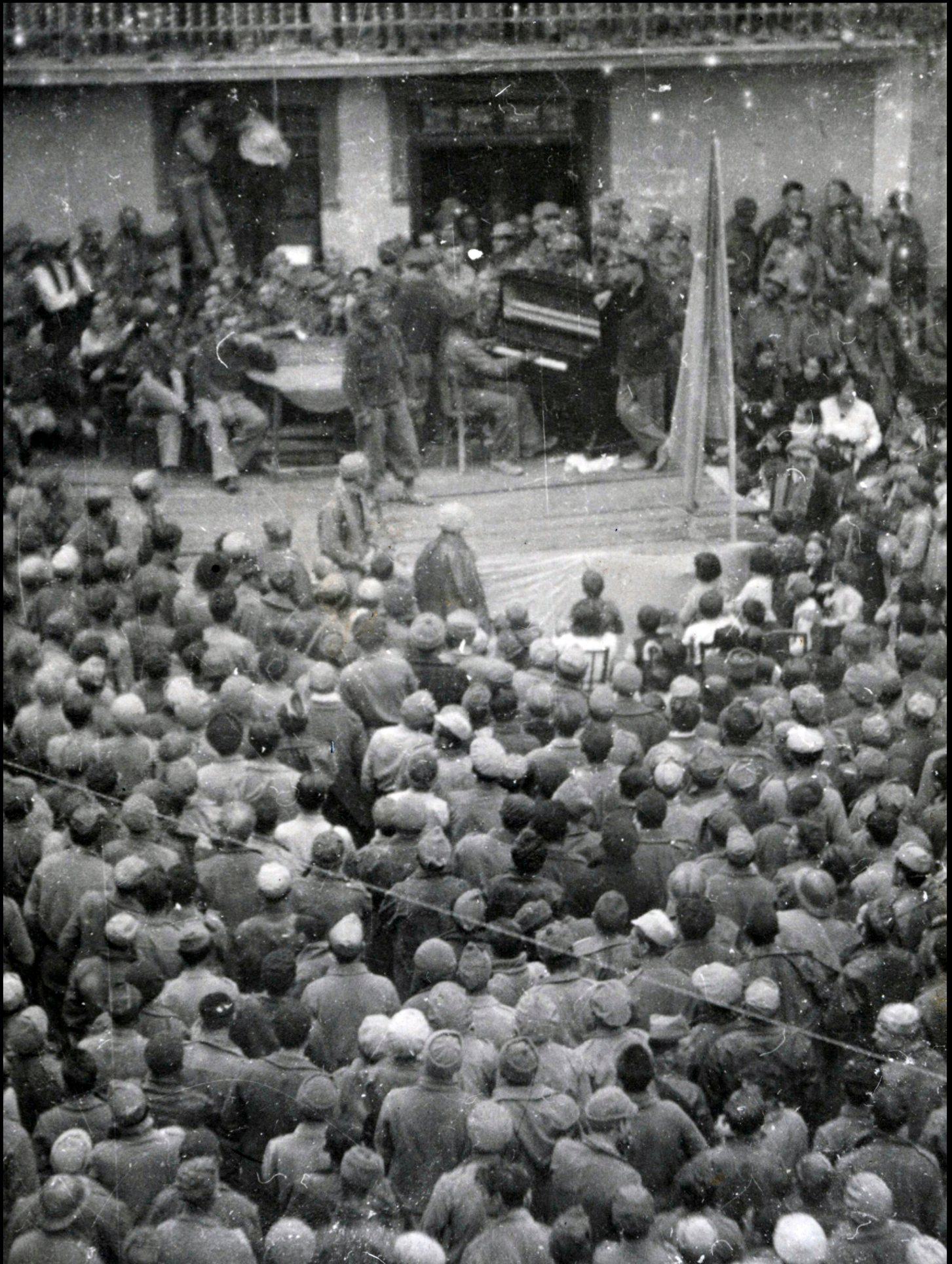
Fiesta aniversario Brigadas, Plaza Vieja