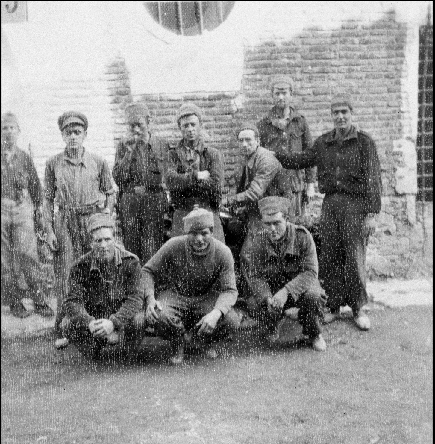
Brigada Scouts en la “Casa del Cura” a la vuelta del frente de Fuentes de Ebro