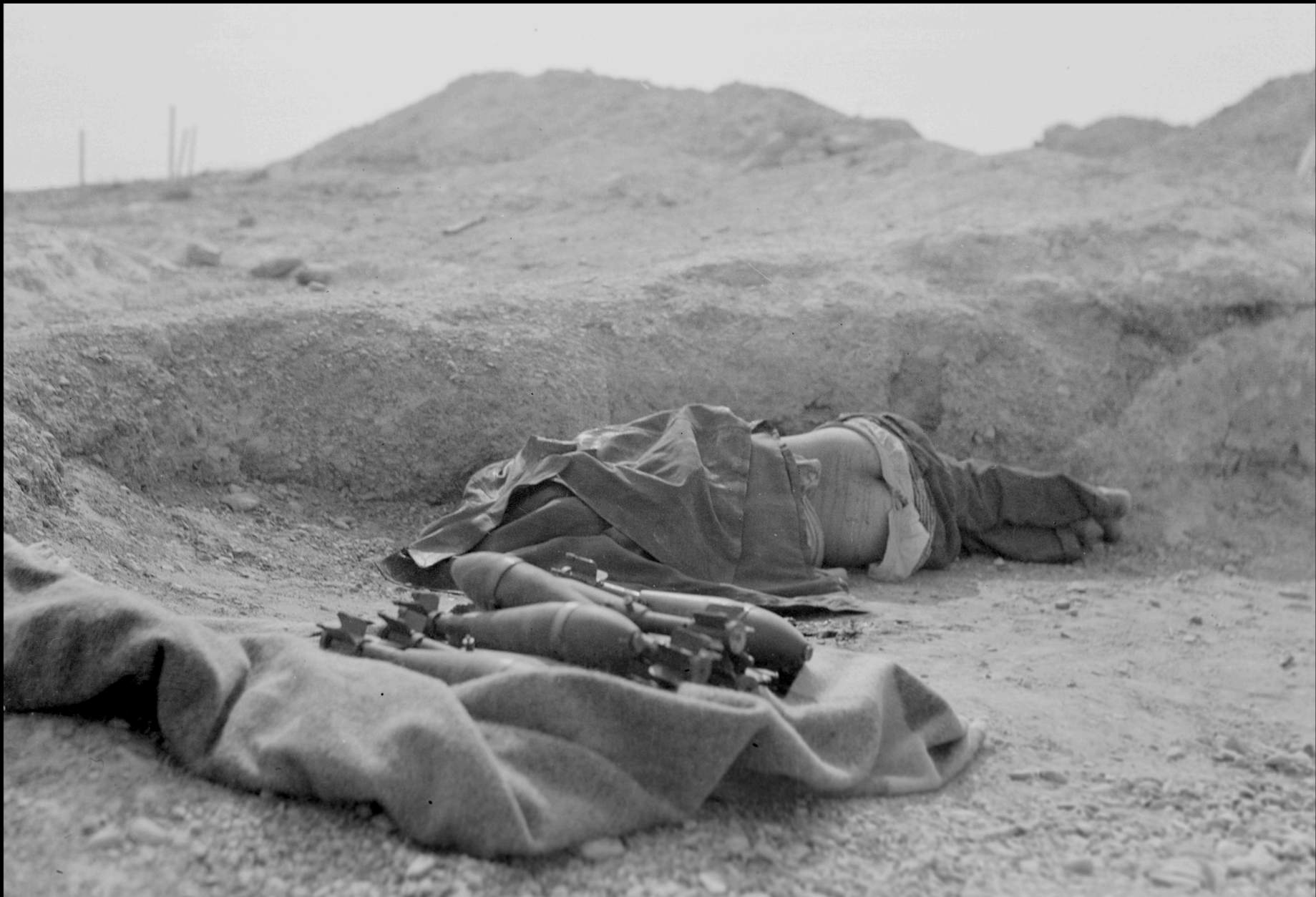
Bombas y soldado muerto en la batalla