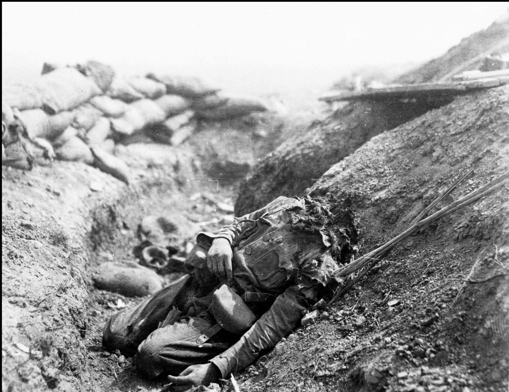
Soldado muerto en trinchera