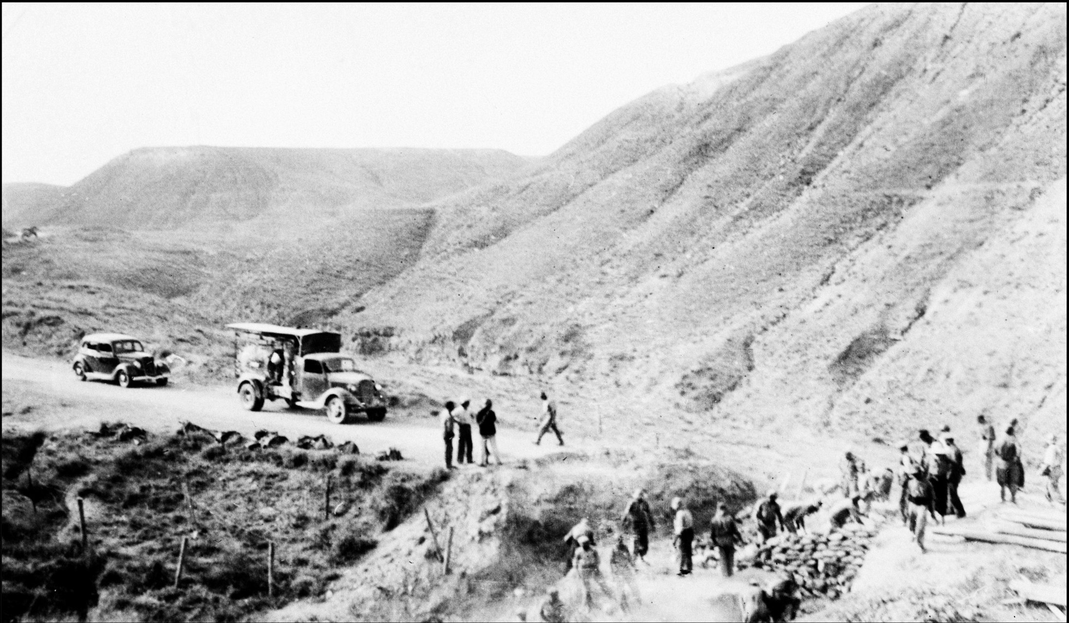
Reparación Carretera en la Revueltilla