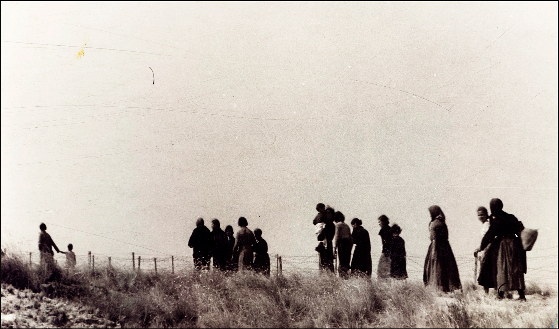
Evacuación de civiles hacia la Loma el Cornero