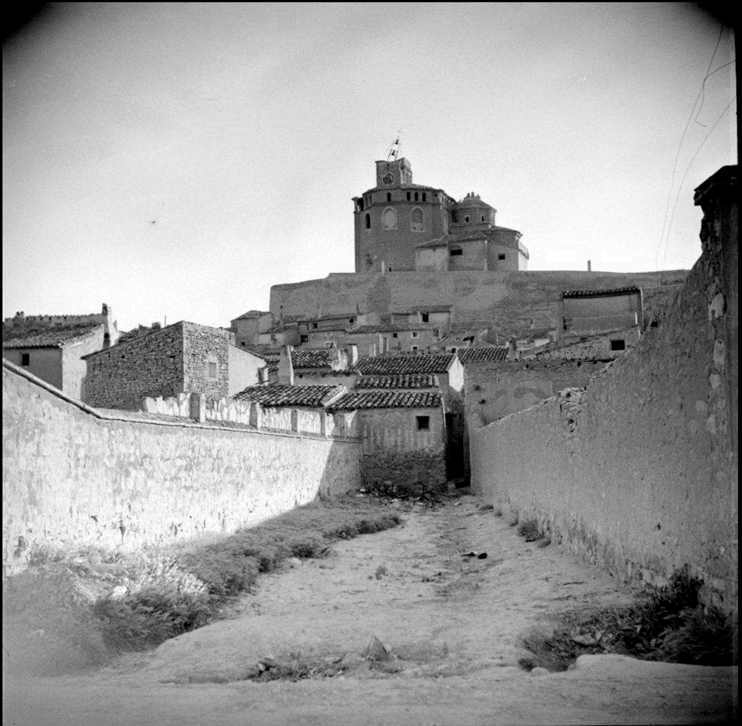
Iglesia de la Asunción, Piquete Vista desde calle de las Escuelas