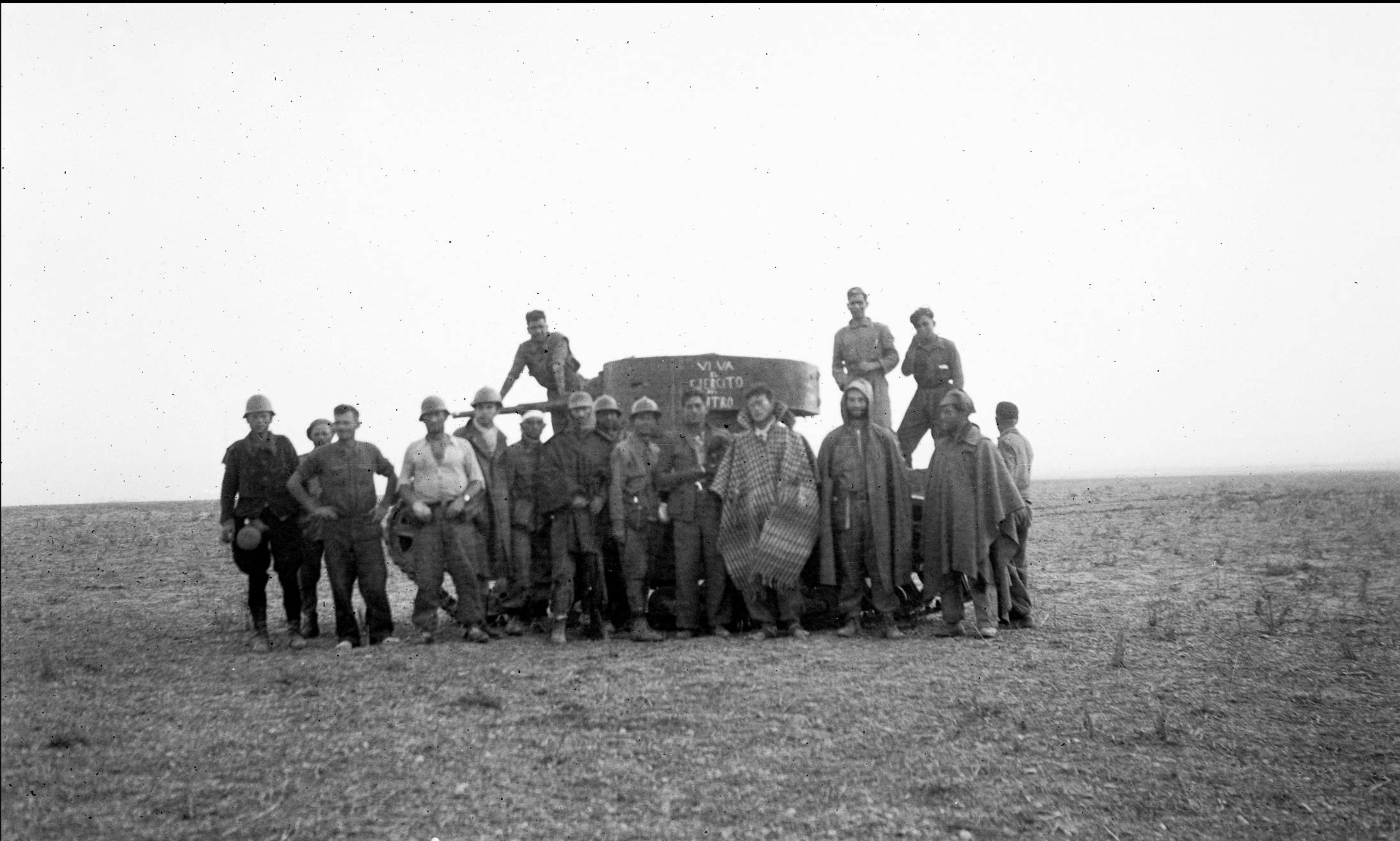
Unidad acorazada republicana