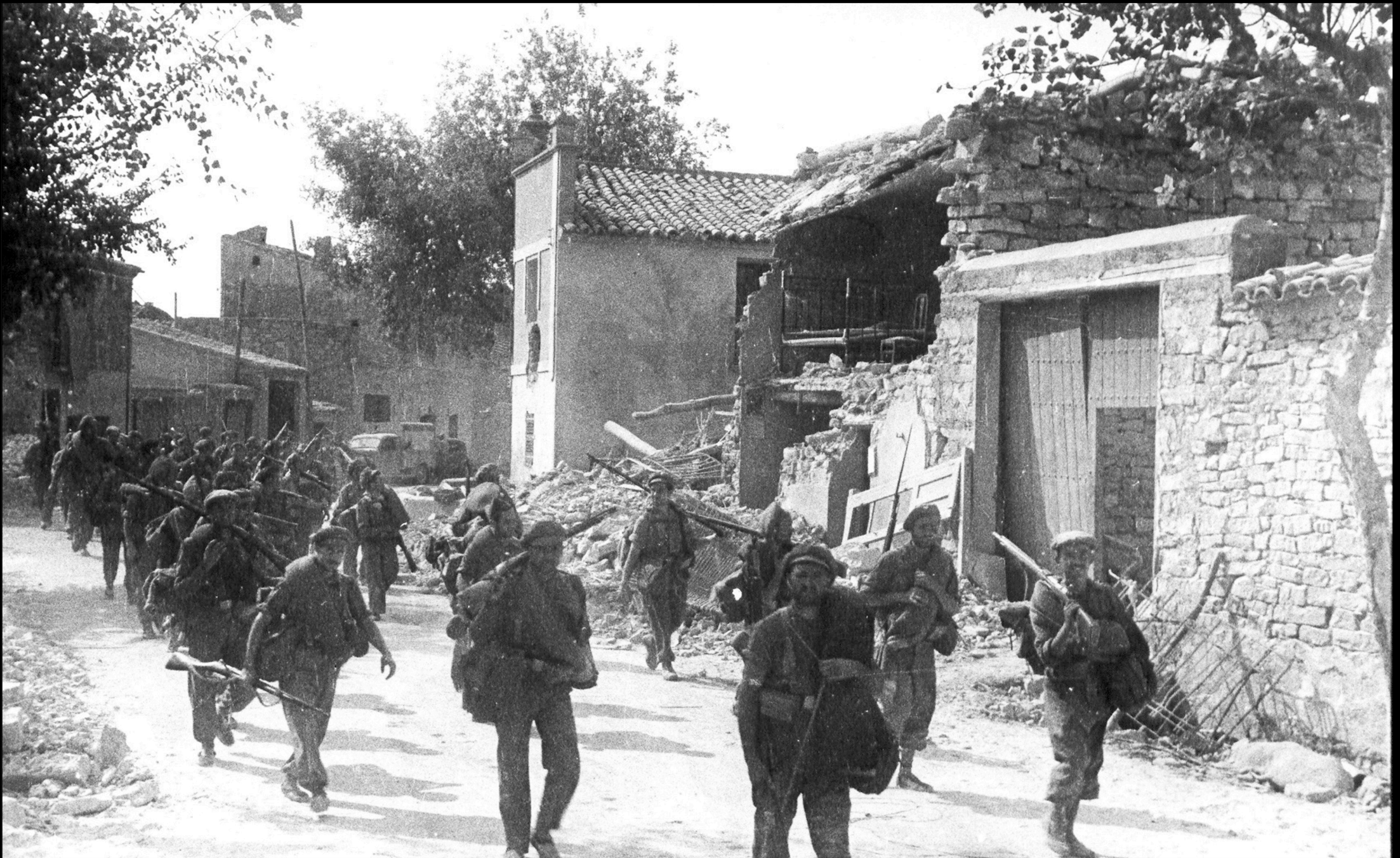
Tropa republicana en el Puente San Juan