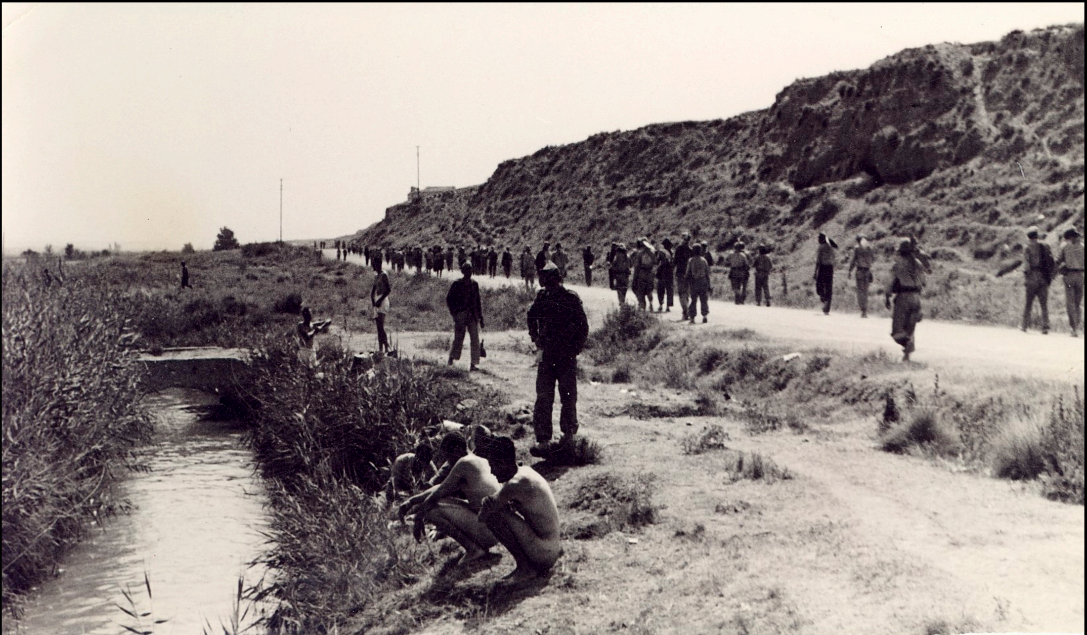
Soldados tras la toma de la estación de Pina