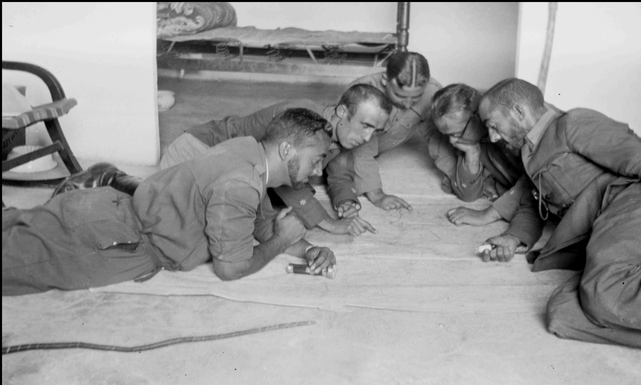
Oficiales ejército nacional