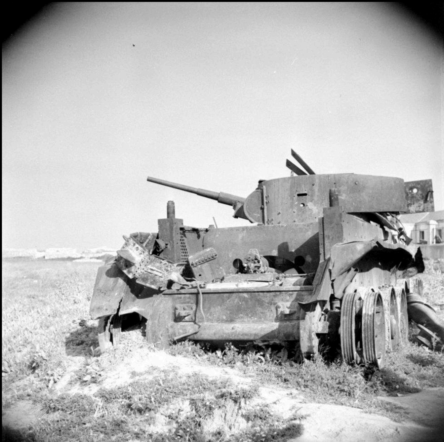
Tanque abandonado junto carretera