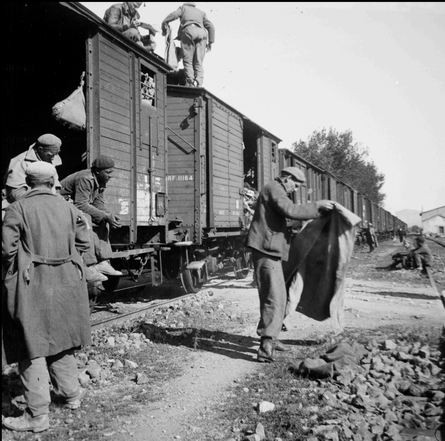
Viaje en tren de Quinto a Ambite (Madrid) Estación de Quinto