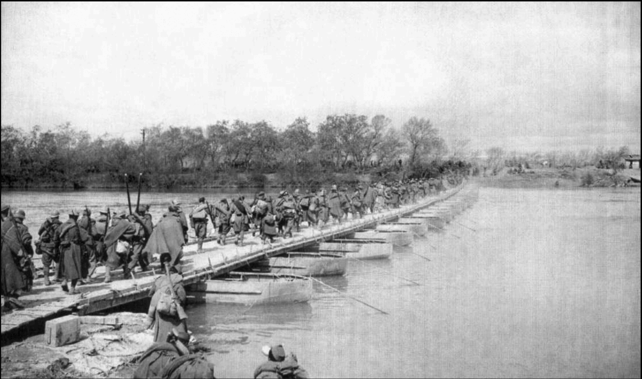
Tropas nacionales en Belloque