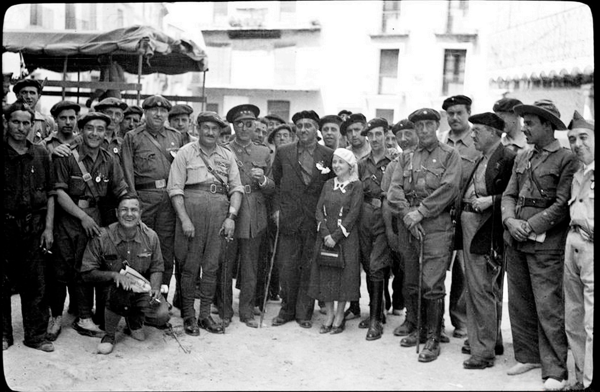
Visita de mandos al Tercio Requete María de las Nieves en la Plaza Vieja de Quinto