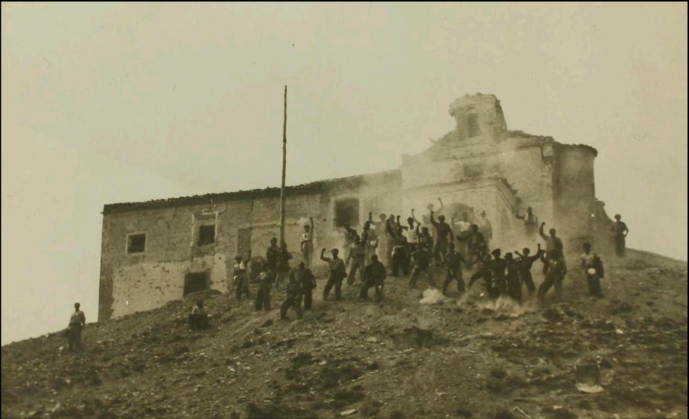
Toma de Bonastre