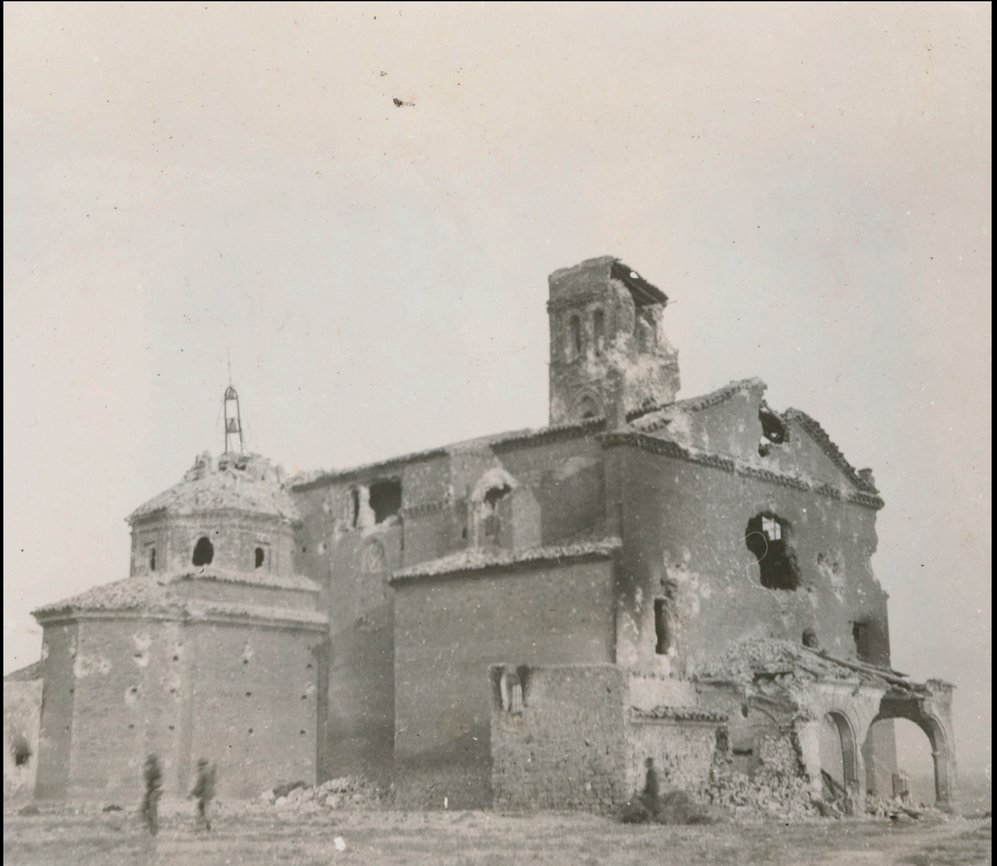
Iglesia de la Asunción "El Piquete" tras la toma de Quinto el 27 de Agosto