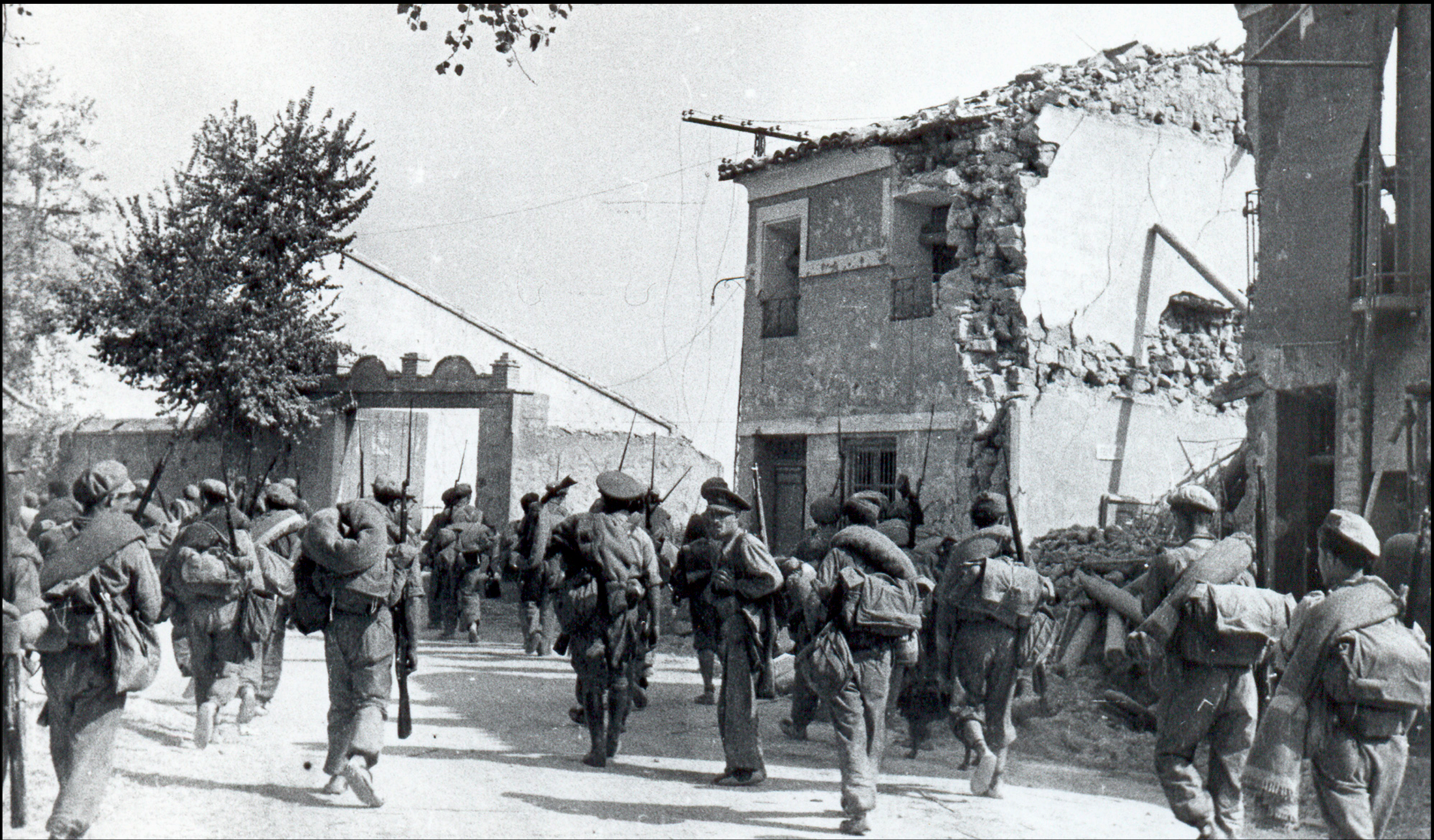
Tropa republicana en el Puente San Juan