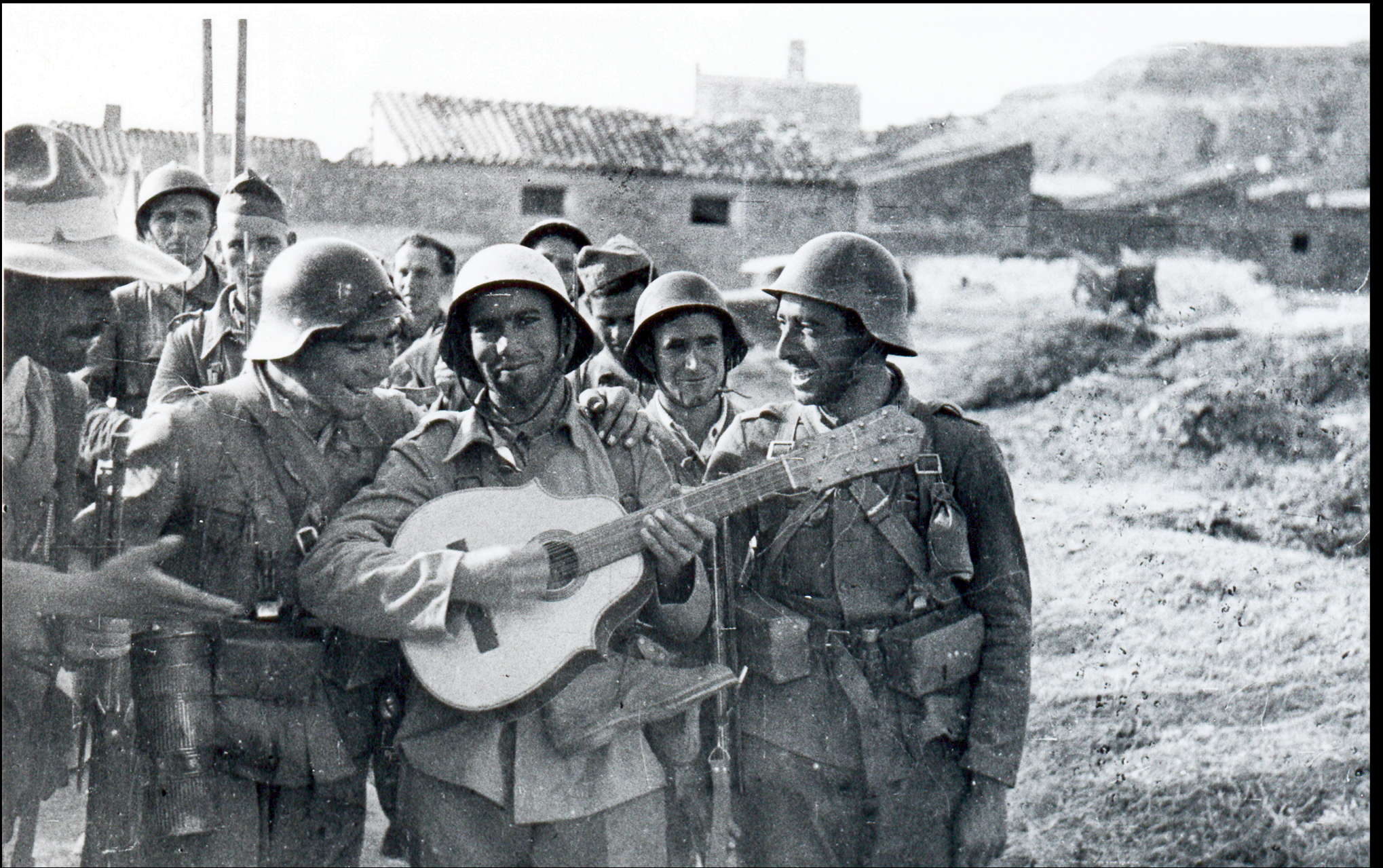
Celebrando victoria, eras del Baño