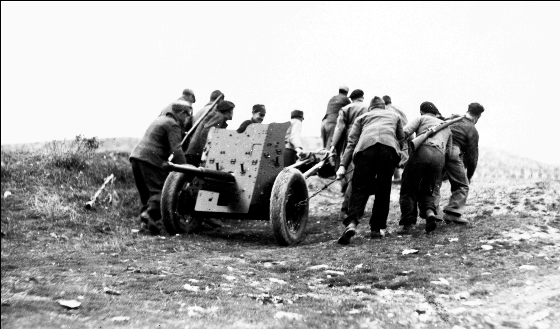
Artillería ligera, ejército republicano