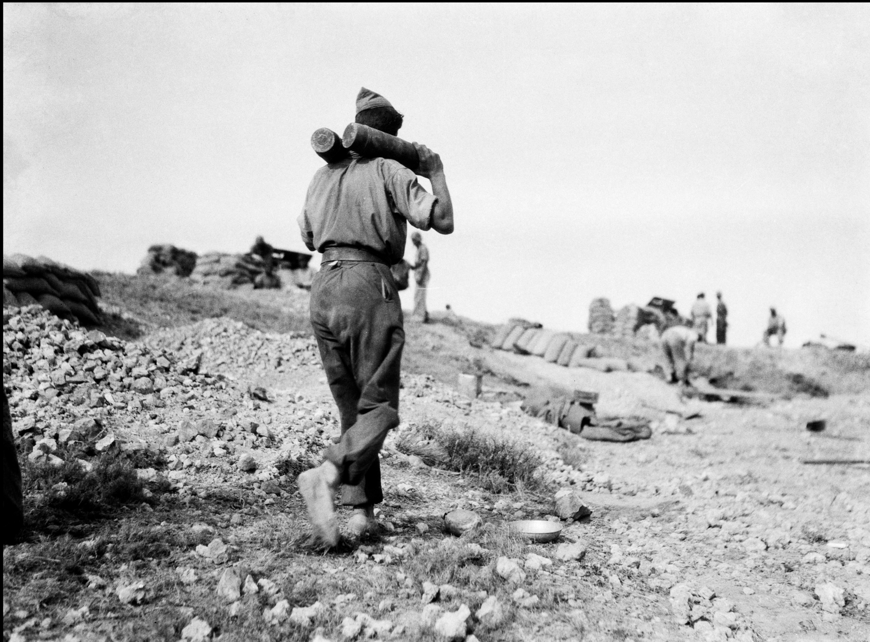
Soldado con bombas para los cañones