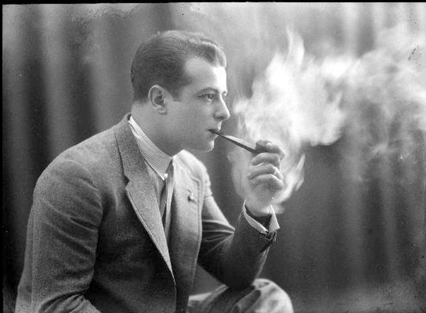
Manuel Coyne Buil Fotógrafo de Zaragoza